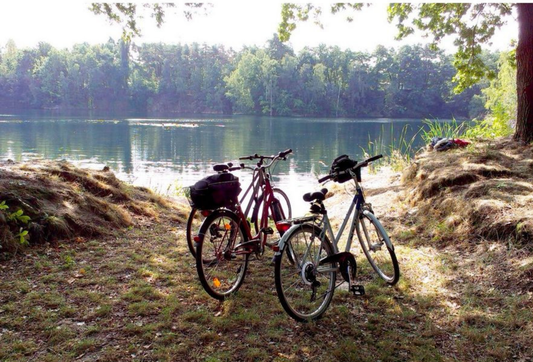
Steinbruch bei Röcknitz

ehemalige Verlauf über Trebsen und Schmölen durch den Planitzwald mit Überquerung der Mulde an der Fähre Dehnitz genutzt werden. Entlang der Hauptroute ist in Nerchau die Verbindung zur Mulde-Elbe-Radrouten gegeben.