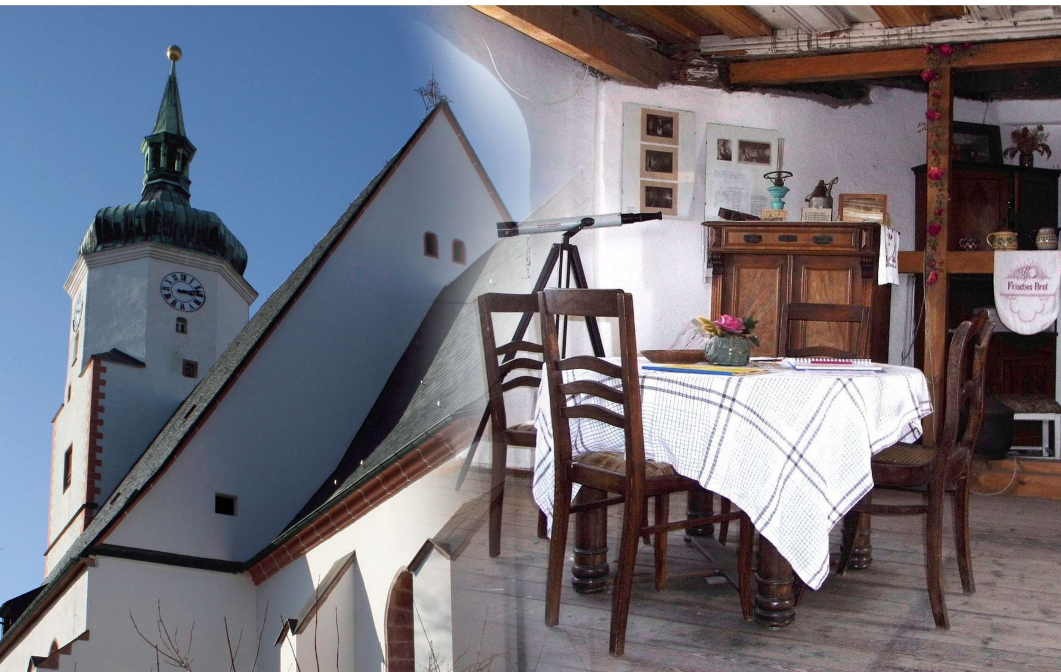
Im Turm der "Wenceslaikirche" wohnte einst der Türmer.

1996/97 mit einer umfassenden Turmsanierung beendet. Das Kirchenschiff, was heute für Ausstellungen genutzt wird, wurde vom Altarraum getrennt und eine neue Eule-Orgel wurde eingeweiht. Wertvolle Ausstellungsstücke blieben erhalten, z.B. ein Altarkruzifix aus dem 15. Jahrhundert. Die einstige Türmerwohnung, gelegen im 52 Meter hohen Turm der Kirche, in der bis 1911 der letzte Türmer lebte, wurde 1997 liebevoll restauriert. Originalgetreu als Museum eingerichtet, ist sie heute wieder öffentlich zugänglich und vermittelt einen Eindruck vom Leben der damaligen Türmerfamilie. Aus den Fenstern der Wohnung kann man einen weiten Panoramablick über die Dächer der Stadt genießen. 2019 erhielt das Gotteshaus drei neue Kirchenglocken.