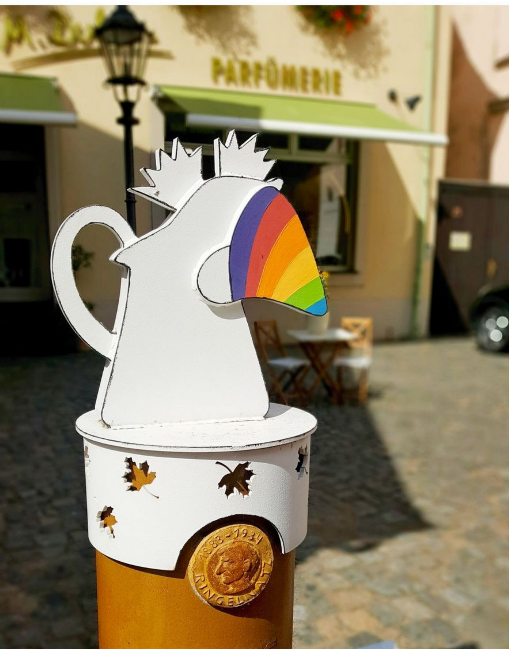
Ringelnatzstele am ehemaligen Jacobstor "Ritter Sockenburg" von Mike Haldi

Im Bereich des Badergrabens befinden Sie sich im Tal eines kleinen Baches, der Rietzschke. Der offene Wasserlauf fiel der Stadtplanung zum Opfer. Heute plätschert die Rietzschke in Rohren unter der Straße entlang in Richtung Mulde. Ursprünglich war der Badergraben ein Teil der alten Stadtbefestigung. Die Rietzschke war hier bis in die Mitte des 19. Jahrhunderts zu drei Teichen aufgestaut - "Baderteich" und diente der Fischzucht. Das Gewässer wurde später trockengelegt und verfüllt. Auch den "Jahrtausendstein" können Sie im Badergraben finden. Die Bürger der Stadt möchten mit diesem Mahnmal an die Opfer von Kriegen und politischer Gewalt im vergangenen Jahrhundert erinnern.