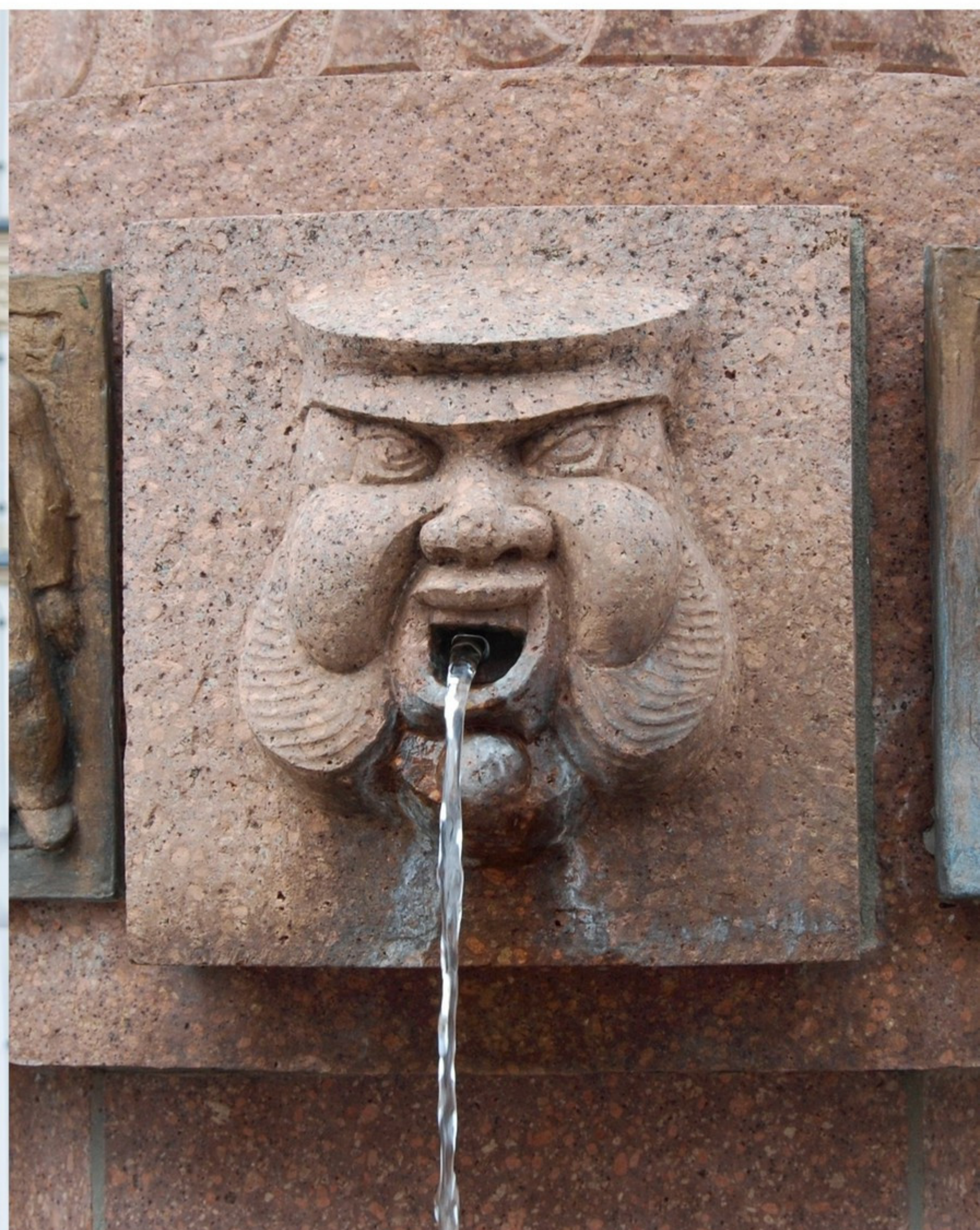
Die Bronzereliefs und vier wasserspeiende Masken wurden nach Werken von Joachim Ringelnatz gestaltet. Die Stele des Brunnens trägt ein Schriftband mit dem Titel "Überall ist Wunderland" und wird gekrönt von einem Klabautermann mit den Gesichtszügen von Ringelnatz, der auf einem Seepferdchen reitet.