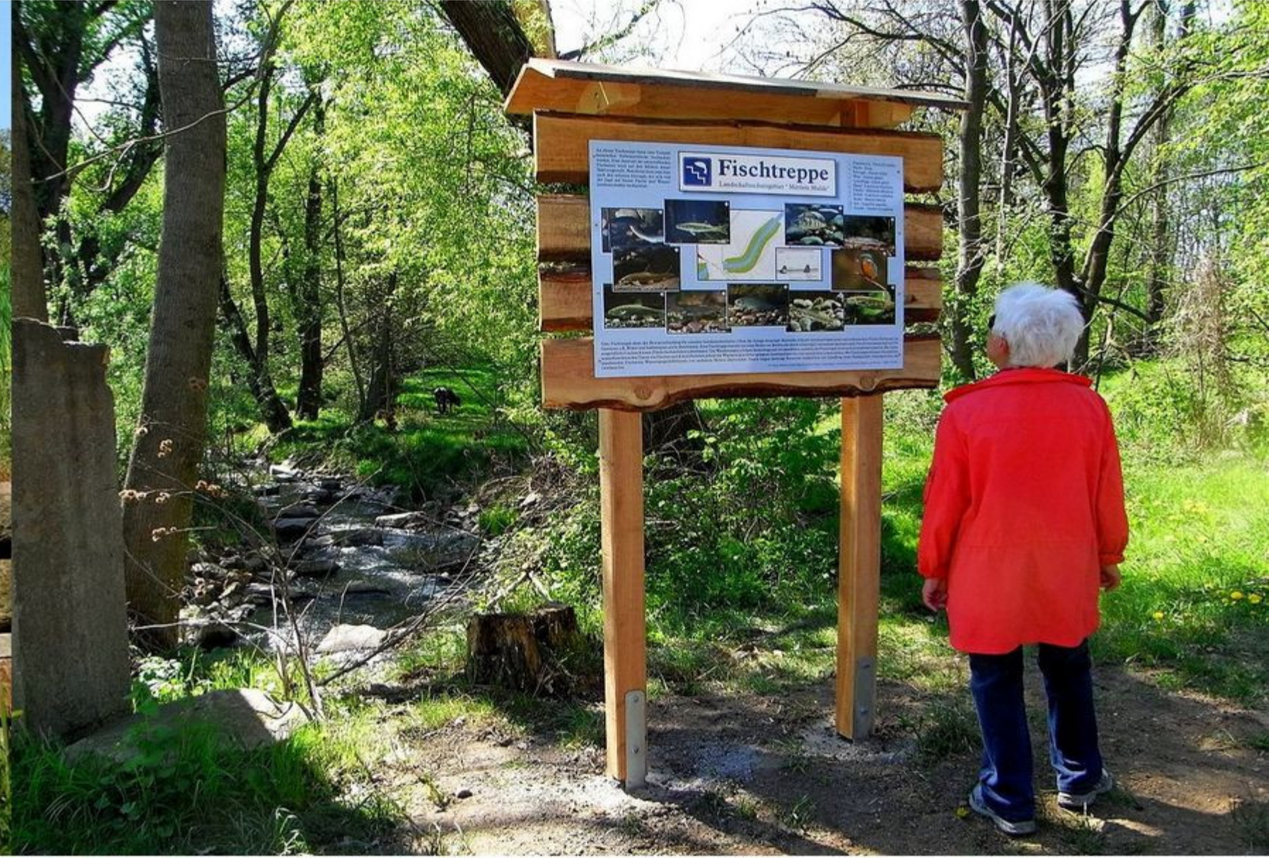
Naturlehrpfad "Goldenes Tälchen"

Naturschutz ist inzwischen tief in unserem Denken und Handeln angekommen. Neben dem Schutz von Tieren und Pflanzen, gefolgt vom Schutz des oberirdischen und unterirdischen Wassers, sind auch Böden, Mineralien, Fossilien oder Gesteinsformationen aufgrund ihrer Seltenheit und ihres Alters eindeutig Schutzgüter. In Gebieten mit außergewöhnlichen geologischen Objekten und Phänomenen werden Geoparks eingerichtet, die Erdgeschichte erlebbar machen, sich um die Bewahrung des besonderen geologischen Erbes bemühen und so zur Umweltbildung beitragen. Sechzehn zertifizierte Nationale Geoparks und weitere Geopark-Gebiete gibt es in Deutschland. Der Nationale Geopark Porphyryland. Steinreich in Sachsen erstreckt sich östlich der Großstadt Leipzig über 1.200 Quadratkilometer entlang der Zwickauer, Chemnitzer und vereinigten Mulde von Rochlitz im Süden bis Thallwitz im Norden sowie von Brandis im Westen bis Mügeln im Osten.