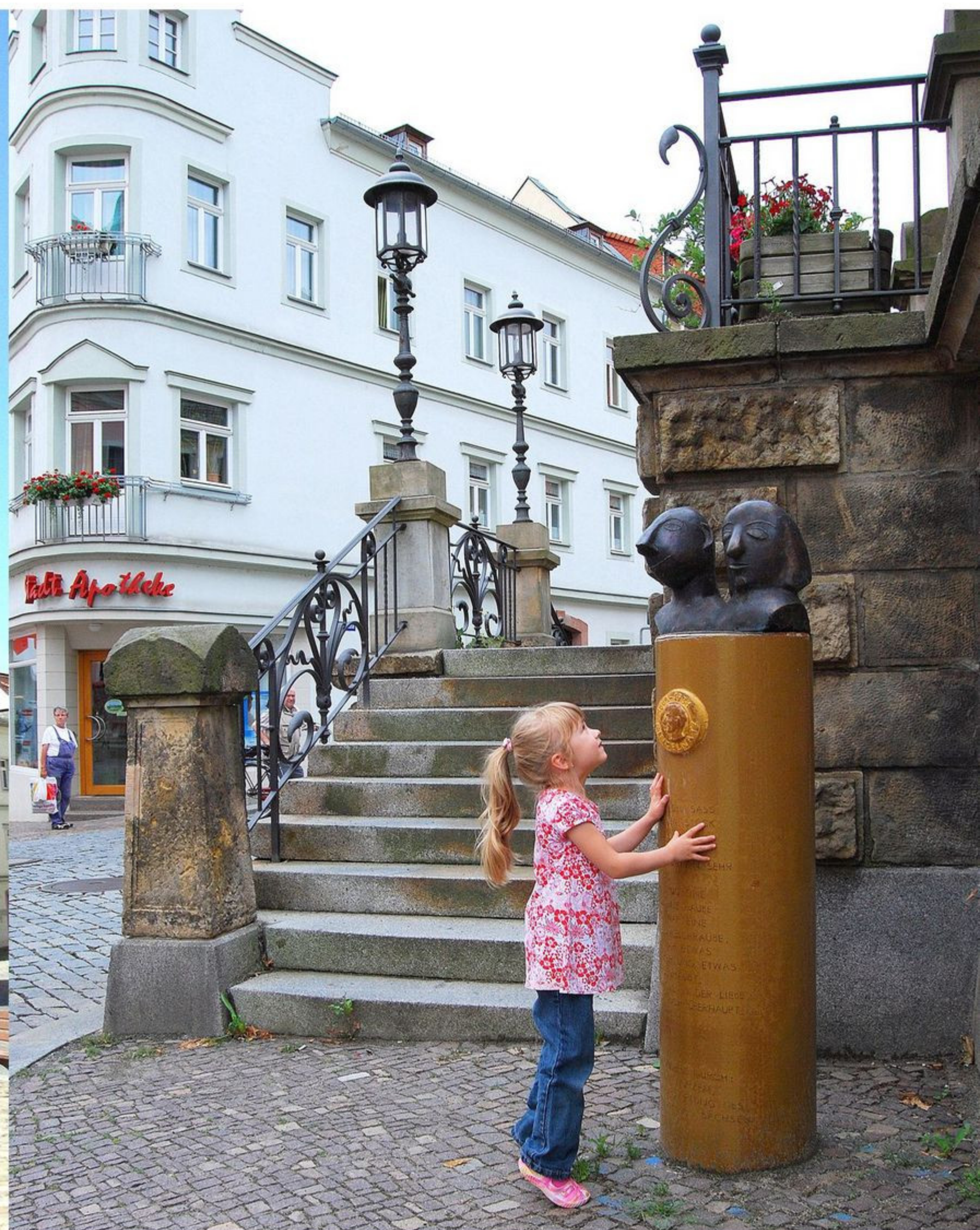
Ringelnatzstele an der Liegenbank "Ein Nagel saß in einem Stück Holz" von Ute Hartwig-Schulz

Unter der Liegenbank befanden sich Kellergewölbe, die früher als Verkaufsbänke zu Markttagen genutzt wurden. Diese waren bis 1902 noch sichtbar. Ihr heutiges Aussehen erhielt die Liegenbank nach einem Umbau im selben Jahr.