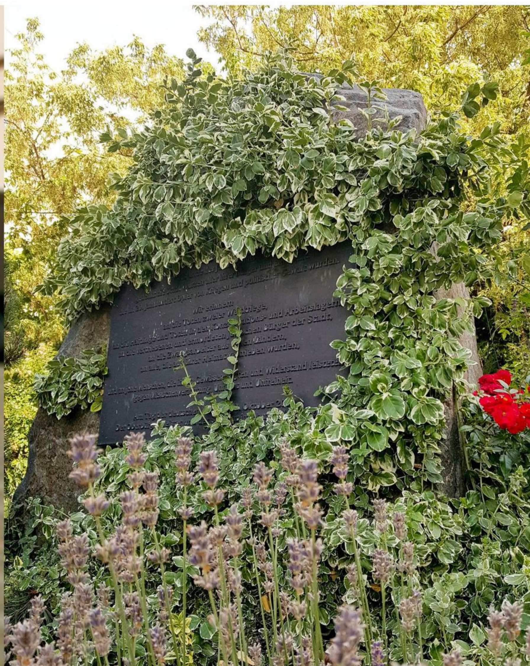
Der "Jahrtausendstein" im Badergraben