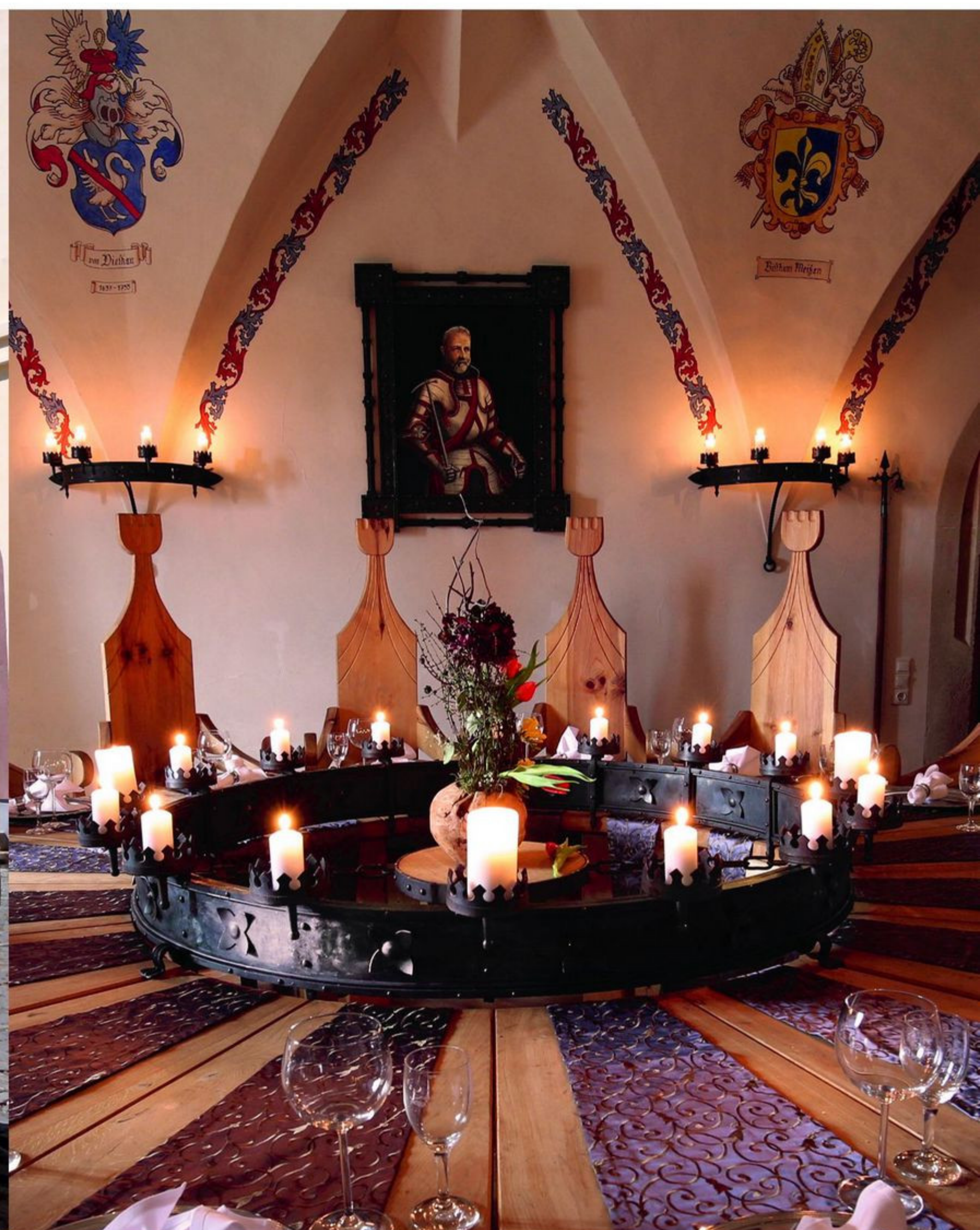
Herrenzimmer im Schloss Trebsen