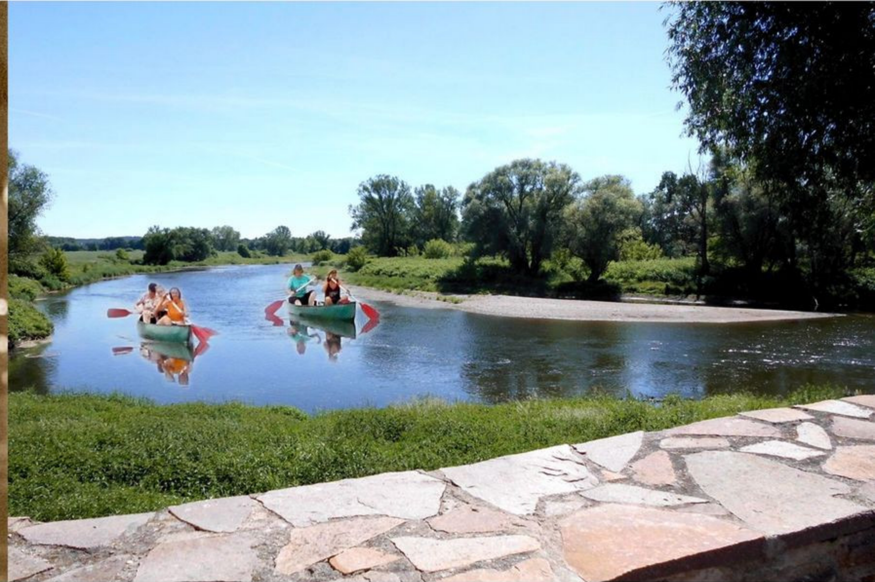
Die vereinte Mulde bei Wurzen - der nicht schiffbare Elbenebenfluss gilt bei Hochwasser als schnellstfließender Fluss Europas.

Der 125. Geburtstag von Joachim Ringelnatz wurde 2008 feierlich begangen. Neben einem Fest ganz im Stil der Goldenen Zwanziger Jahre, der Herausgabe einer Sonderbriefmarke ihm zu Ehren und der Erweiterung der Ringelnatz-Sammlung wurden der "Ringelnatzpfad" und das "Ringelnatzgässchen" eingeweiht.