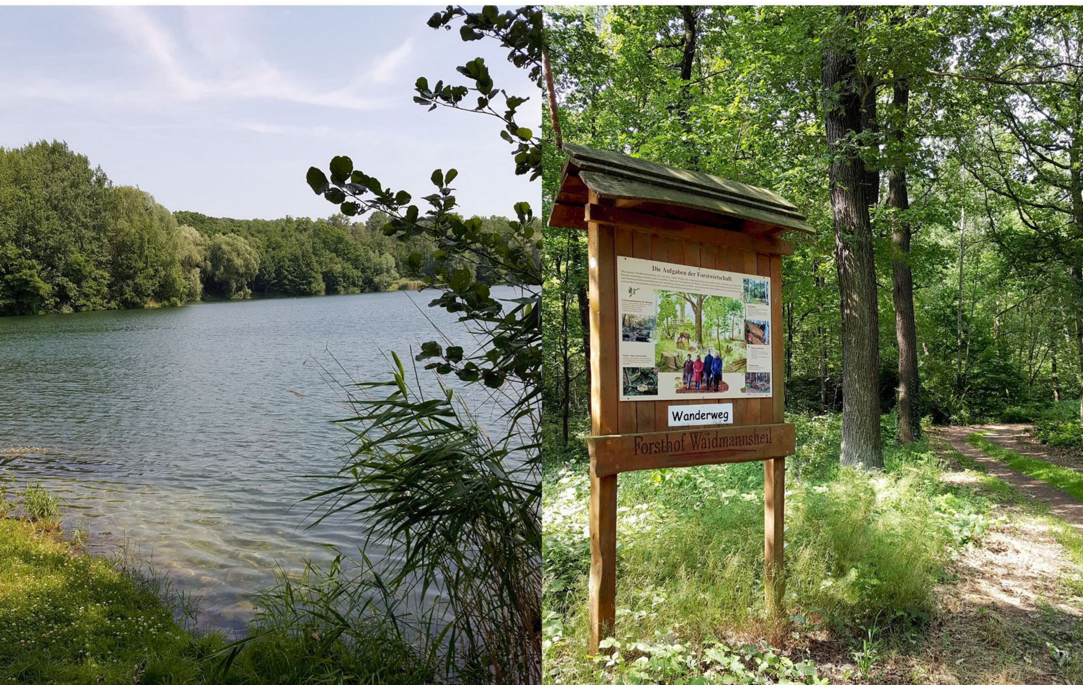
Kaolinsee bei Hohburg