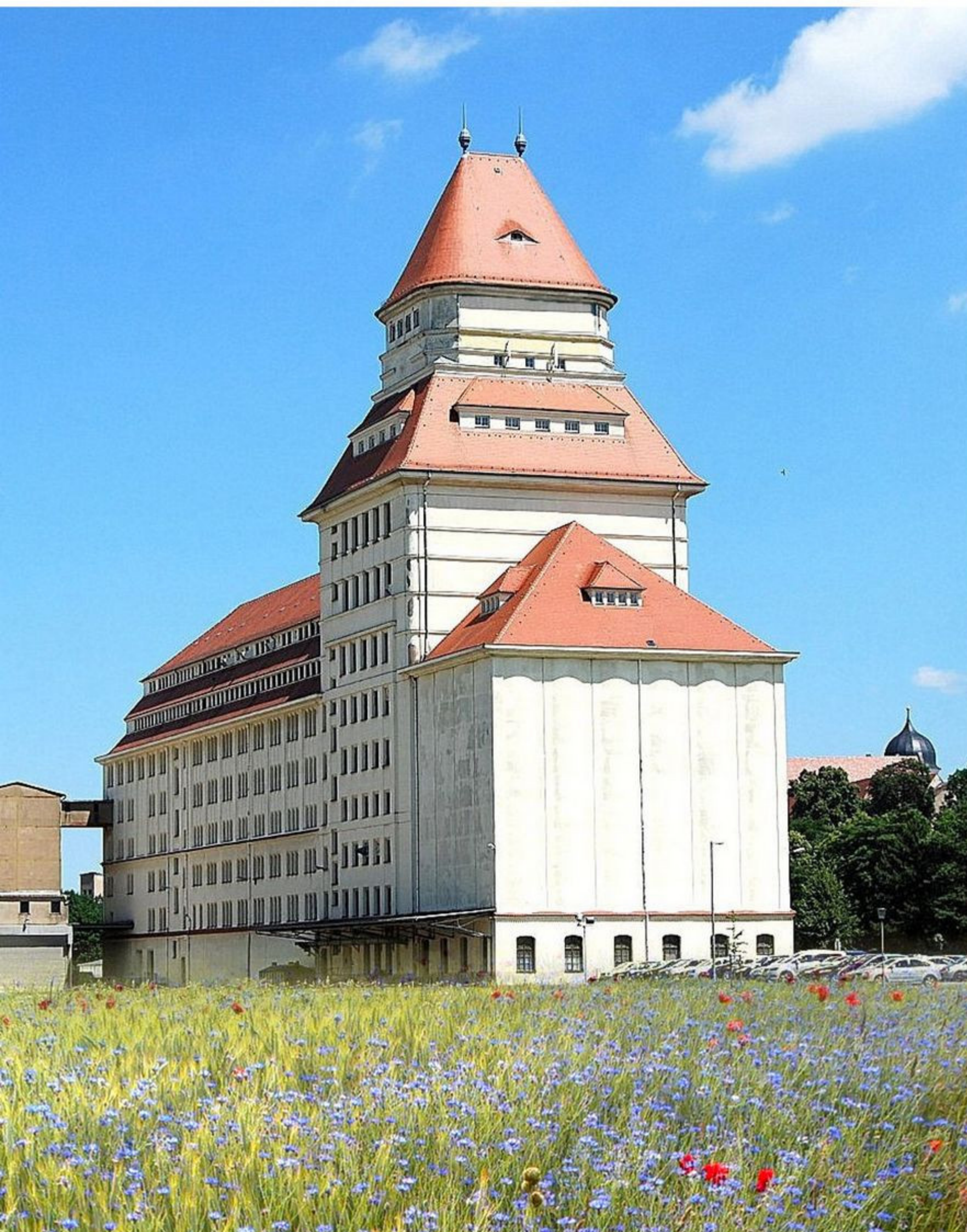
Mühlentürme der ehemaligen Krietschwerke

Heute setzen zwei renommierte Unternehmen die Produktion von Nahrungsmitteln an diesem traditionellen Standort fort. Unter anderem werden die berühmten Wurzener Flips und feines Gebäck dort hergestellt und sind im Werksverkauf in der Marienstraße erhältlich.