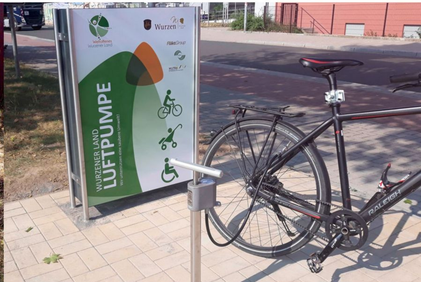
Wurzener Land Luftpumpe

Die Radrouten beginnt auf dem Leipziger Augustusplatz und führt in östlicher Richtung aus der Stadt heraus. Die Stadt Wurzen liegt zwischen den reizvollen Streckenabschnitten Lübschütz-Wurzen (9 Kilometer)/Wurzen-Körlitz (4 Kilometer).