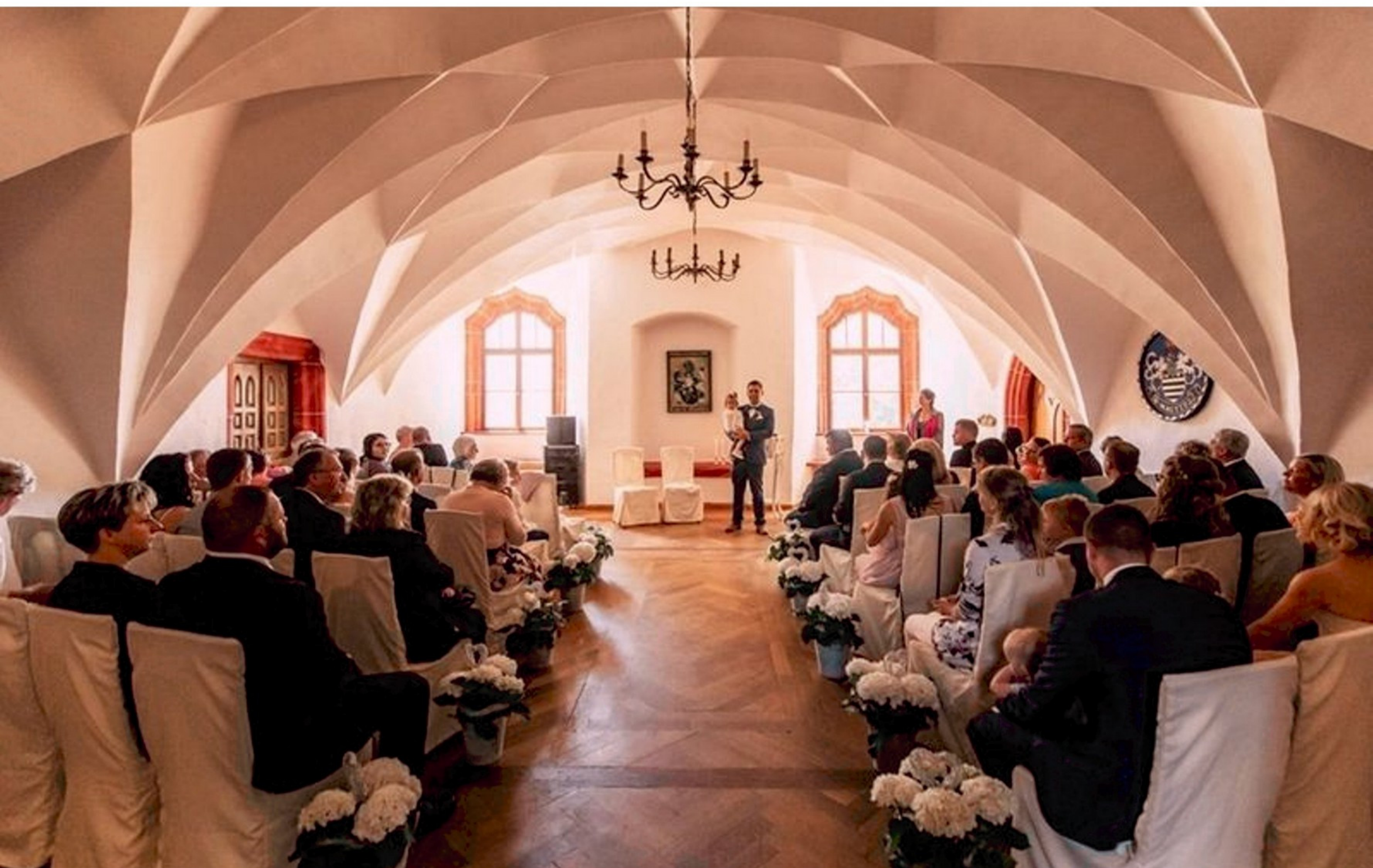
Das romantische Ambiente der alten Zellengewölbe lädt als Veranstaltungsort zu Hochzeiten ein.

Charakter. Der Wendelstein, die Vorhangbogenfenster und die aufwendig gestalteten Zellengewölbe im Inneren des Schlosses erinnern an die Albrechtsburg Meißen. Bis zum Jahr 1581 war es das Residenzschloss der katholischen Meißner Bischöfe. Die Kurfürsten und Herzöge von Wurzen übernahmen bis ins Jahr 1813 die Schirmherrschaft. Es folgte die Nutzung als Stiftsamt und später der Umbau zum Amtsgericht, 1930 zum Kreisgericht. Nach 1945 wurde das Schloss durch die Polizei und andere Behörden genutzt. Das Schloss beherbergt heute ein Hotel mit Restaurant und Café. Besucher können bei einer Schlossführung auf einzigartige Weise die spannende Geschichte des Hauses erleben.