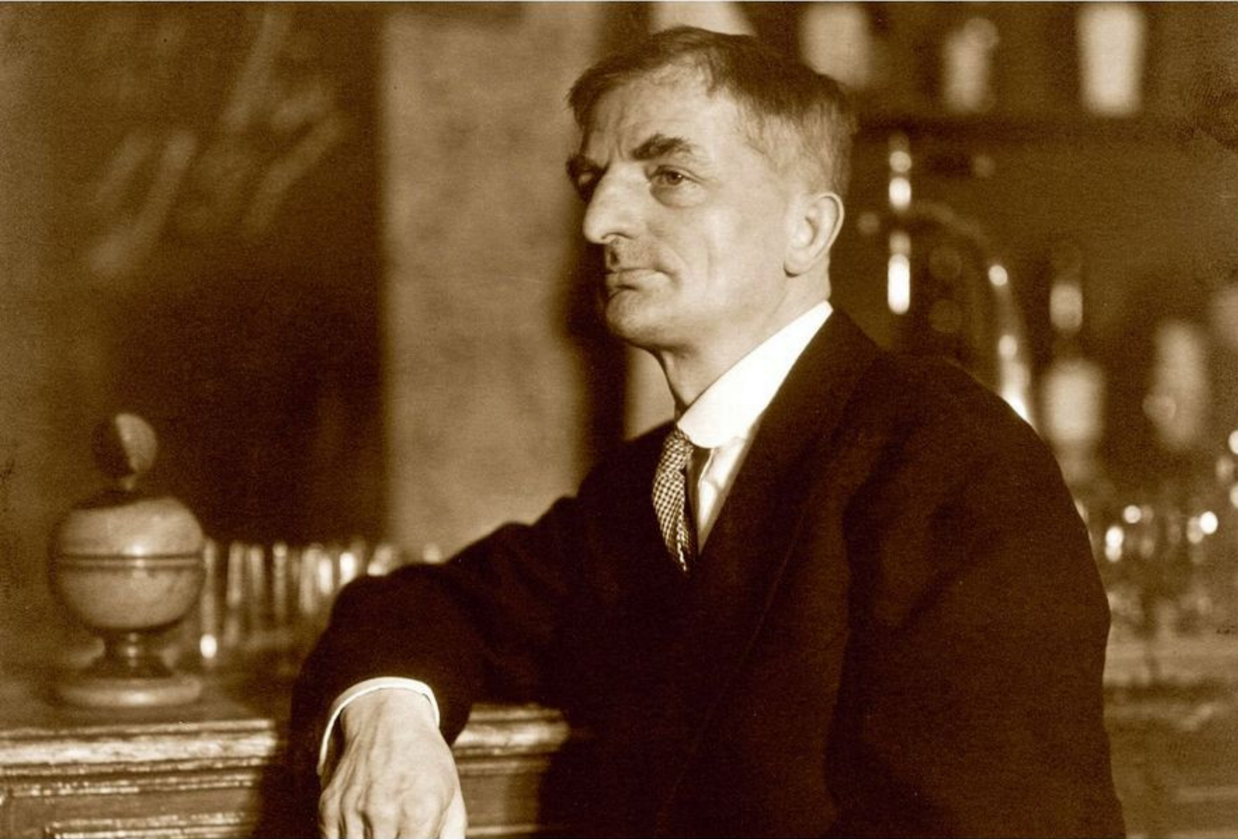
Joachim Ringelnatz ist Wurzens berühmtester Sohn. Sein markantes Konterfei ziert das Logo der Stadt.