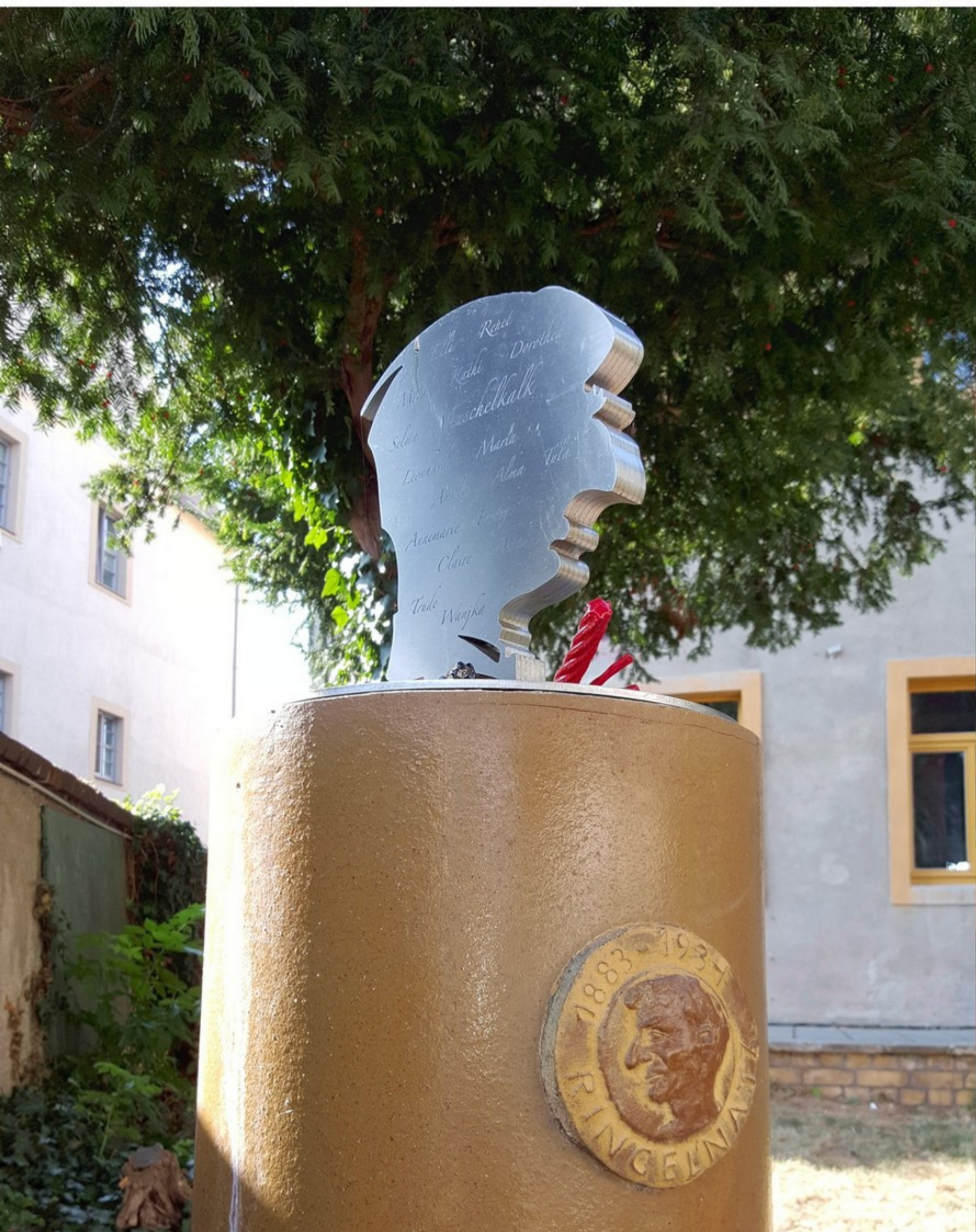
Die Ringelnatzstele zeigt die Skulptur "Die zwei Polis" von Jochen Ziska.

Aus der Fabel "Die Katzen und der Hausherr" stammt der heute geläufige und in die sprichwörtliche Rede übernommene Lichtwer-Vers "Blinder Eifer schadet nur".