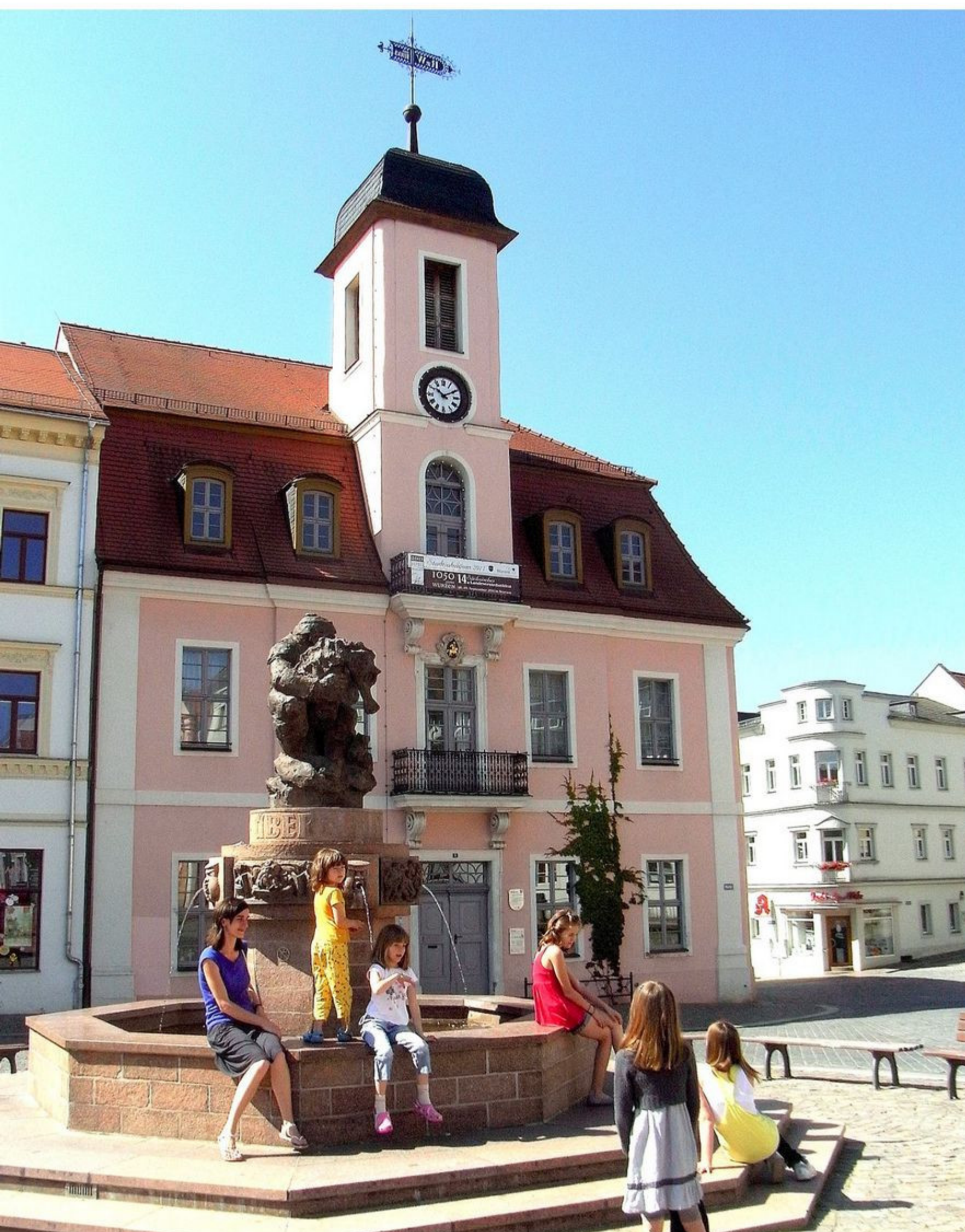
Das Alte Rathaus mit dem Ringelnatzbrunnen im Vordergrund

1993 bis 1995 wurde das Alte Rathaus umfassend rekonstruiert. Es beherbergt heute die Stadtbibliothek sowie die Städtische Galerie am Markt.