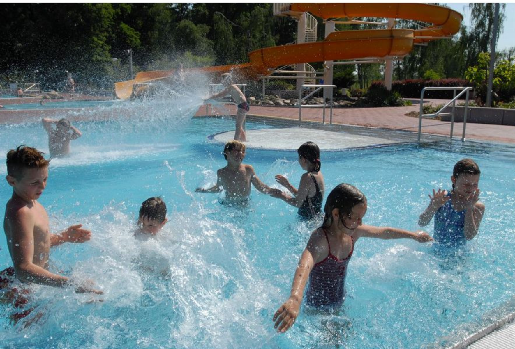
Freizeit- und Erlebnisbad "Dreibrücken"