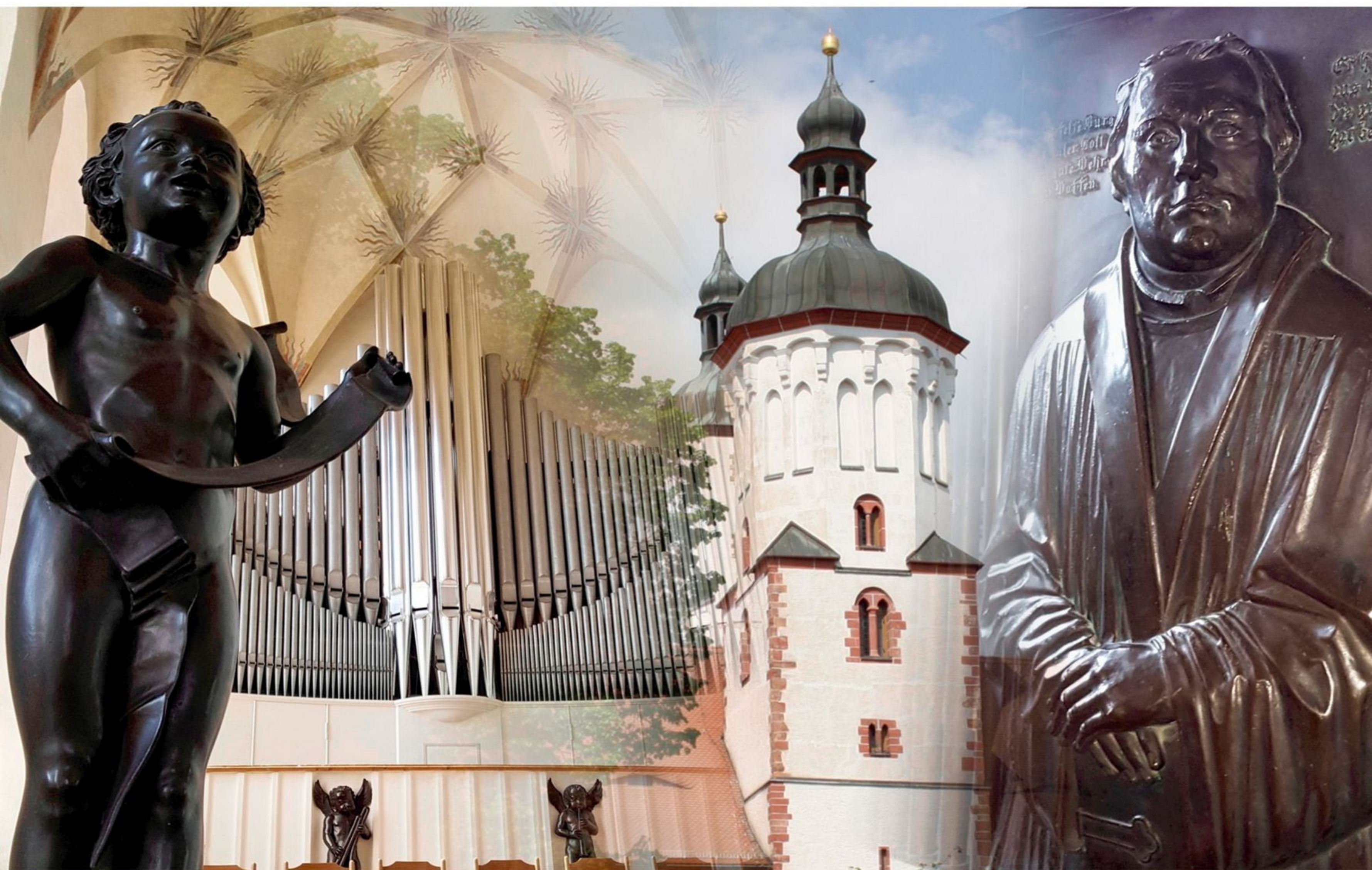
Dom St. Marien mit der Orgel und dem Bronzerelief von Martin Luther