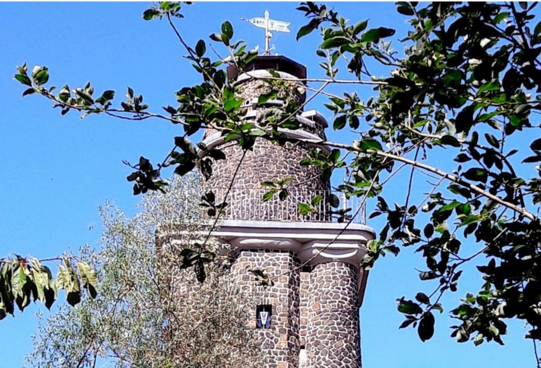
Bismarckturm auf dem Wachtelberg