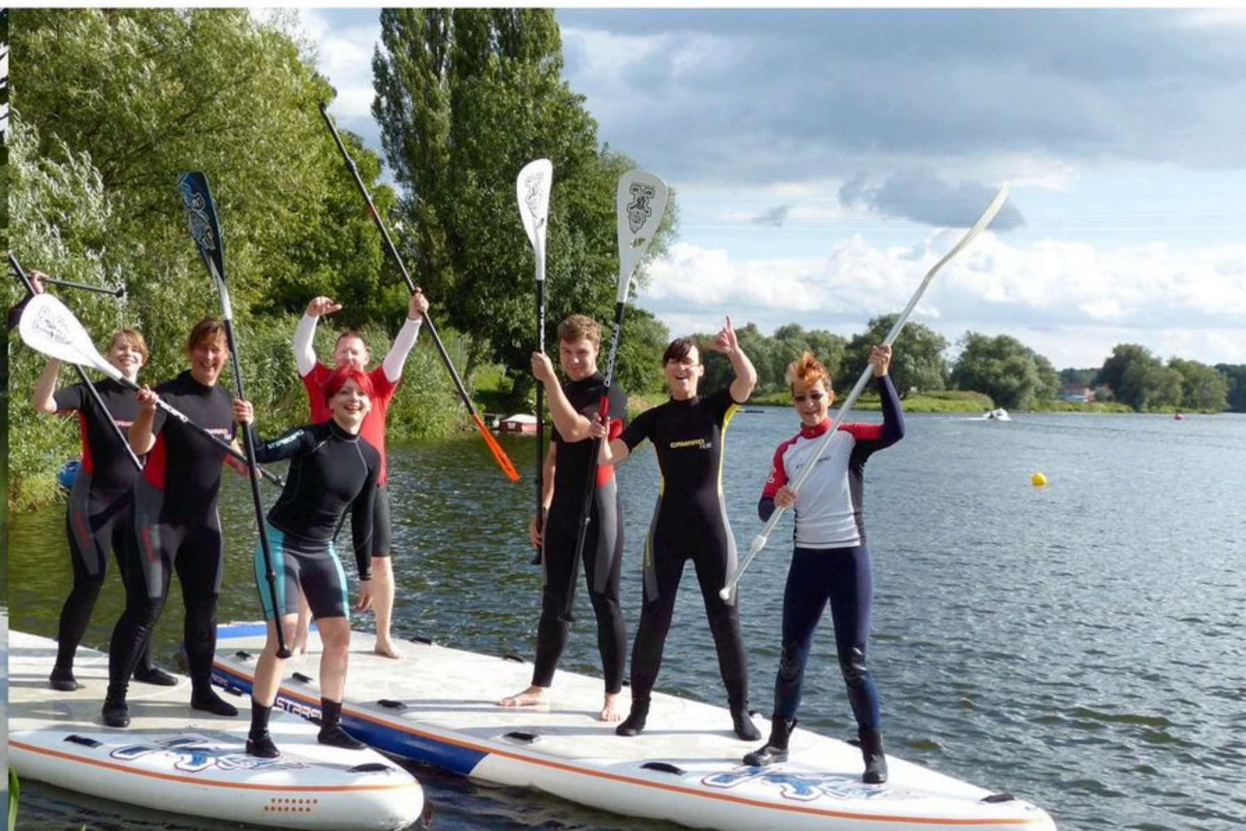
Bootstouren auf der Mulde