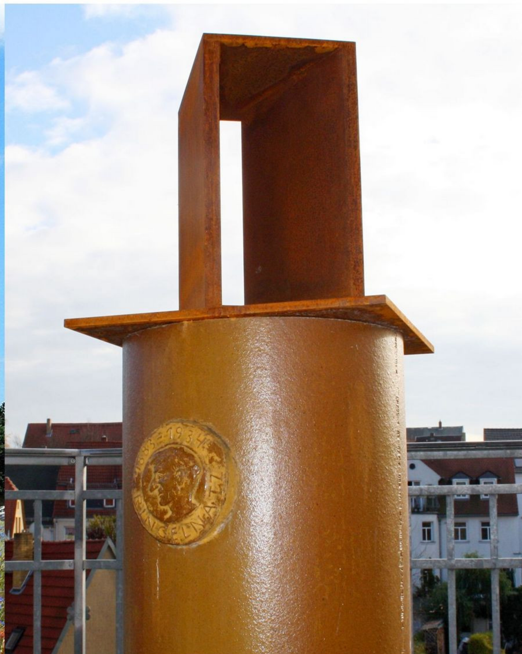
Ringelnatzstele an den Schultreppen "Sieh nicht zurück" von Erik Seidel

Rechts daneben liegt zugleich die dritte Station auf dem Ringelnatzpfad - das Kultur- und BürgerInnenzentrum D5.