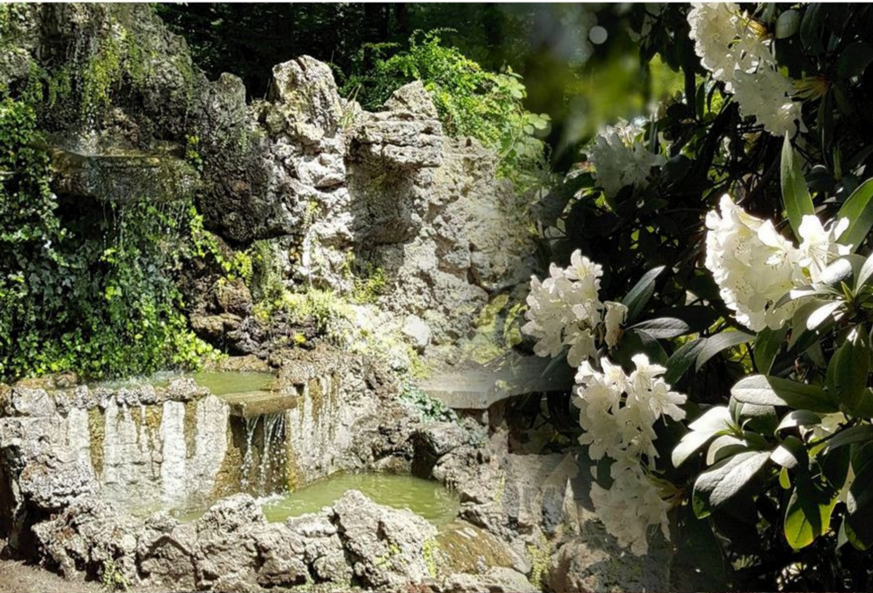
Grotte am Parkteich