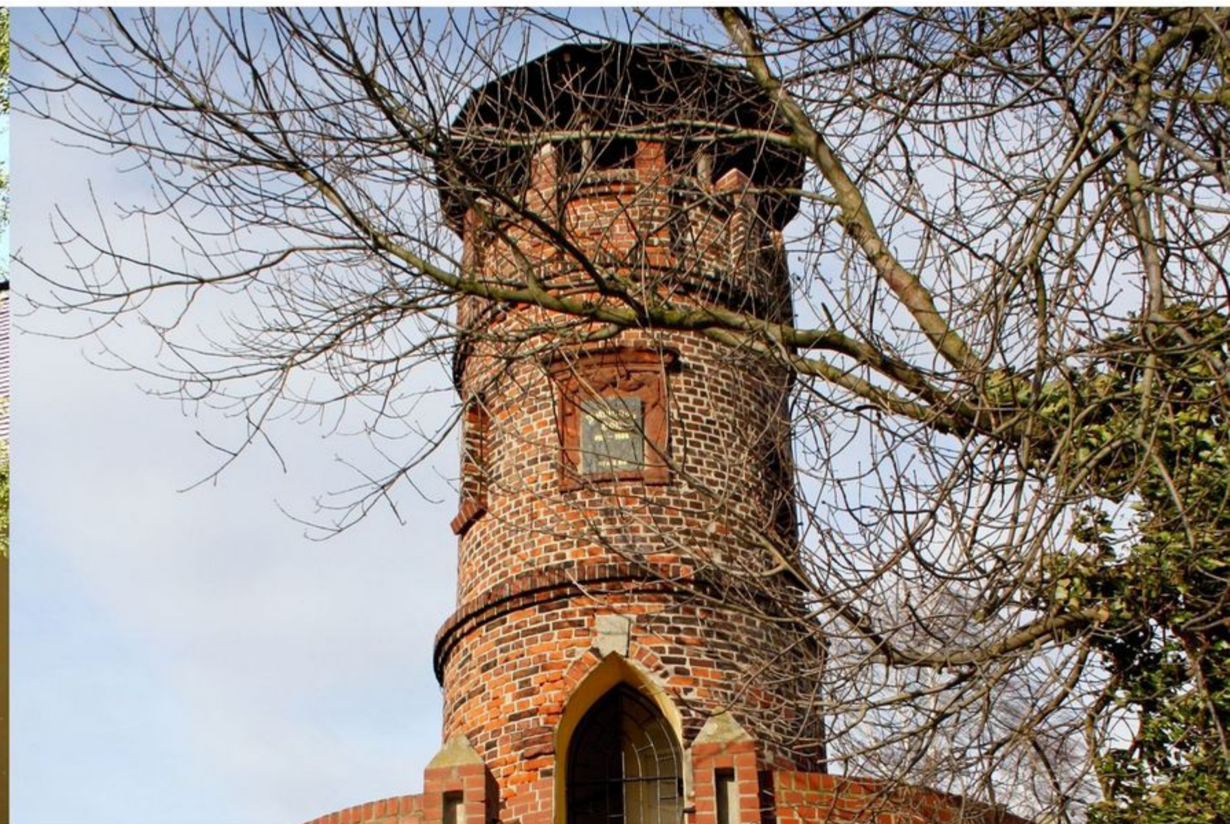
Aussichtsturm "Johannas Höh" in Pyrna

Die Lukaskirche in Nitzschka stammt aus dem 15. Jahrhundert. Die flach gedeckte Saalkirche mit Emporen ist direkt mit dem ehemaligen Rittergut verbunden. Das