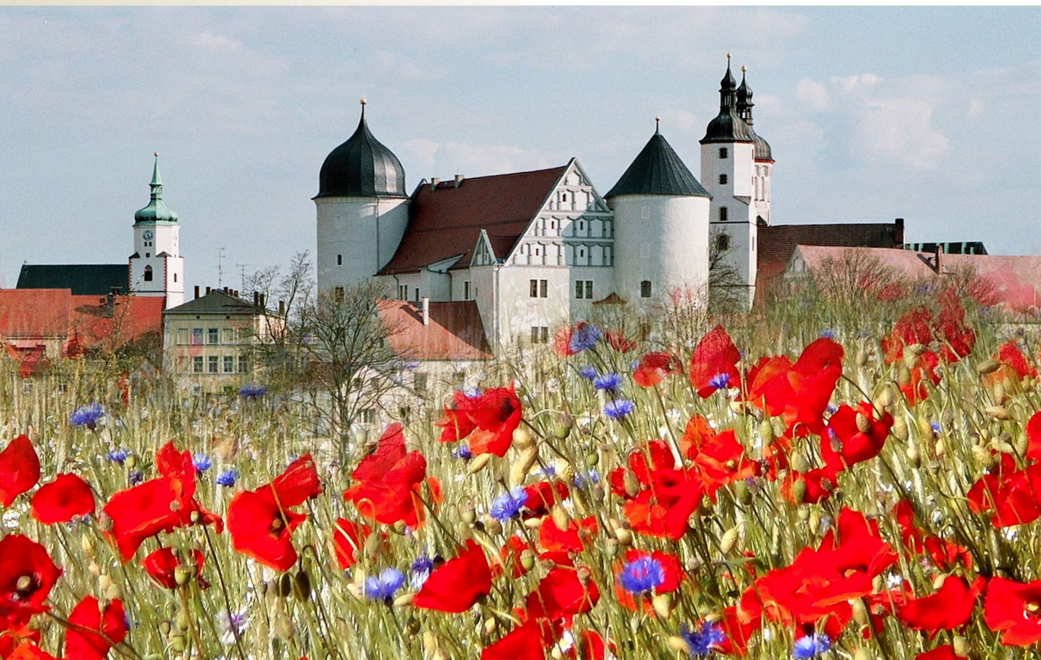
Ein ehrwürdiger Anblick - der Turm der Stadtkirche St. Wenceslai, das Bischofsschloss und der Dom St. Marien

Von Wurzen aus lässt sich auch die Region Leipzig mit ihren Schlössern und Burgenanlagen, der herrlichen Naturlandschaft an der Mulde sowie den hübschen Städten und Dörfern bestens erkunden. Wir wünschen Ihnen viel Spaß beim Lesen dieser Broschüre!