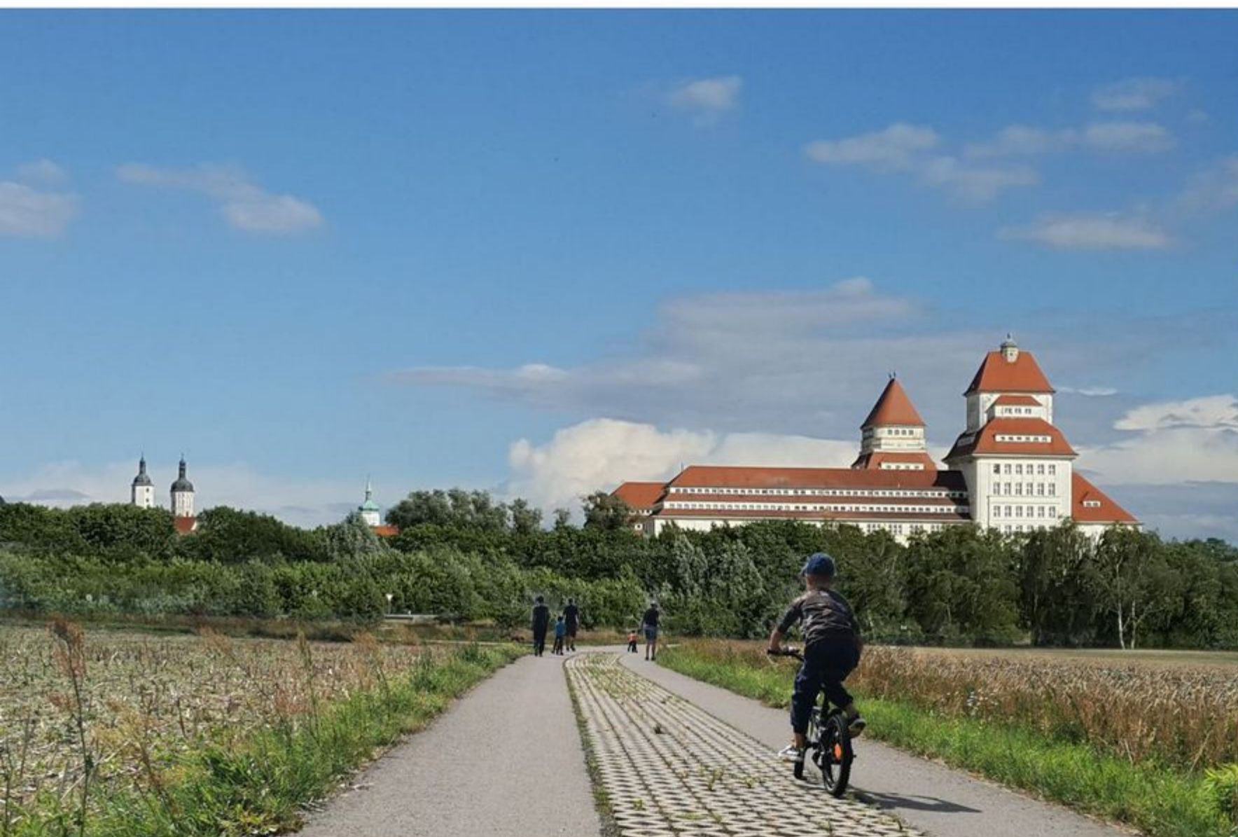
Wandern auf dem Muldental-Wanderweg