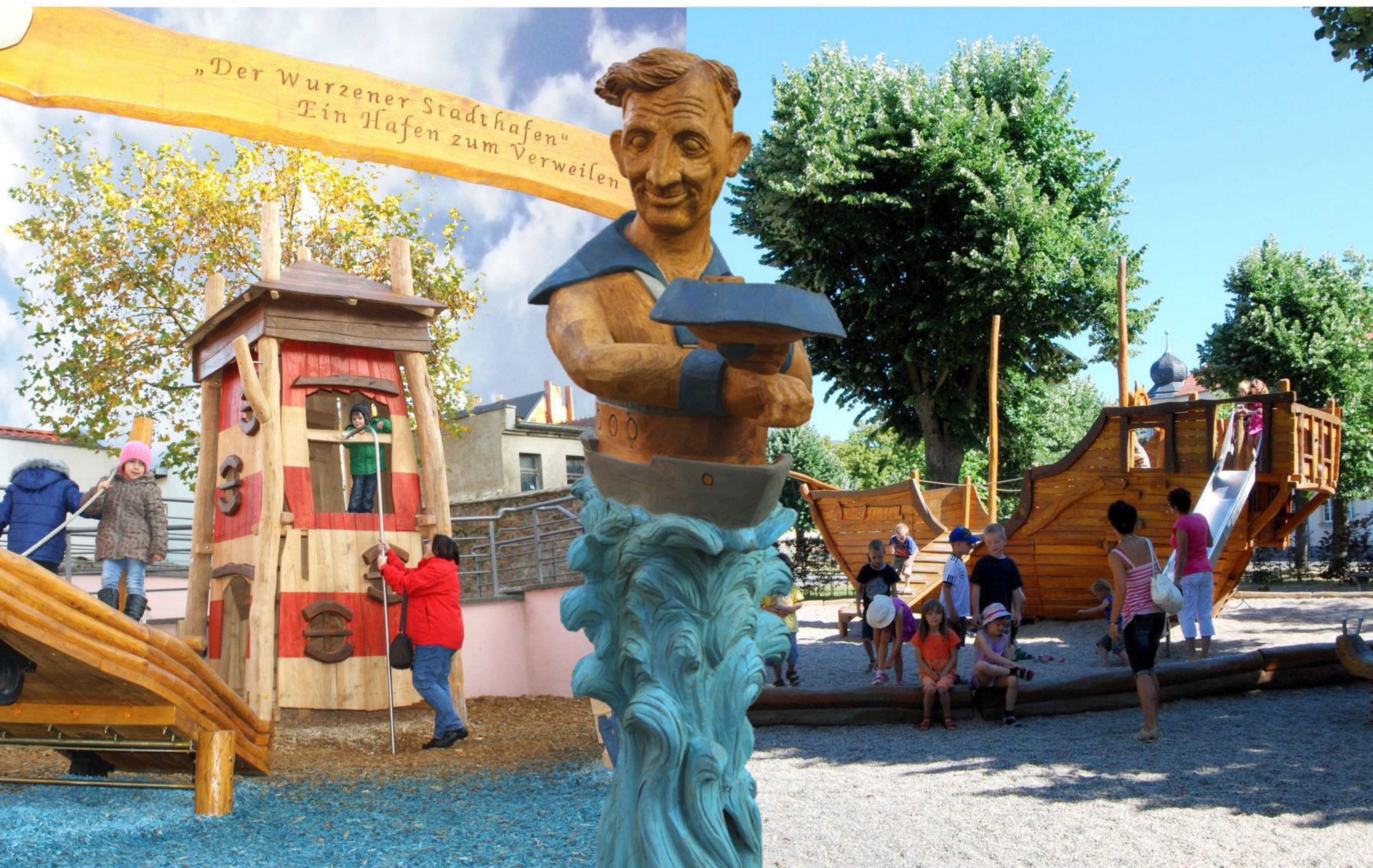
Spielplatz "Hafen zum Verweilen" in der Wenceslaigasse

...und auch Joachim Ringelnatz ist in Skulptur des "Kuttel Daddeldu" gegenwärtig.