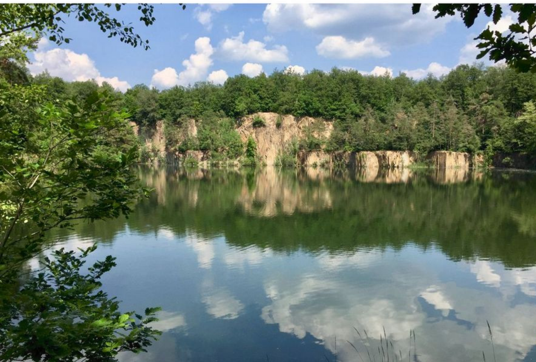
Waldbad Mark Schönstadt