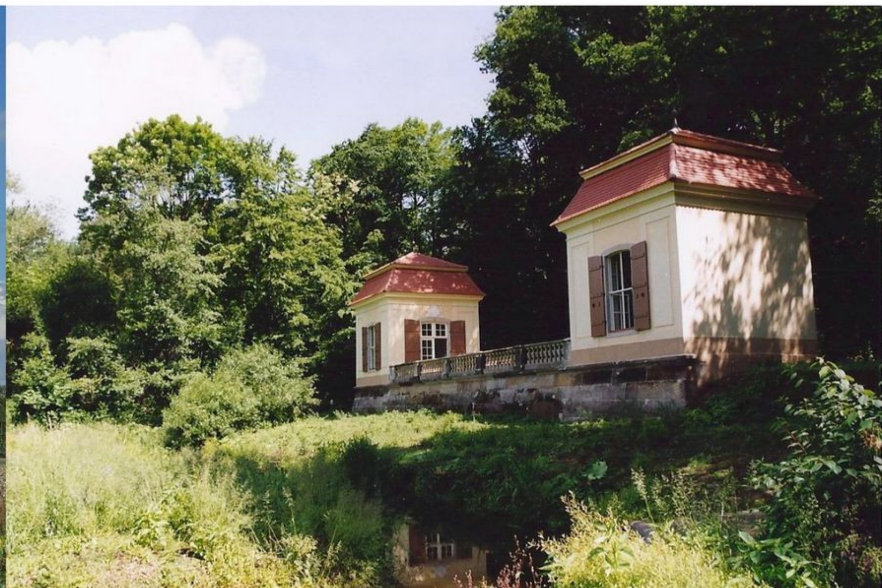
Teehäuser im Schlosspark Nischwitz

D ie herrliche Landschaft um Wurzen lässt sich ausgezeichnet erwandern. Der bekannteste Wanderweg ist der Muldental-Wanderweg.