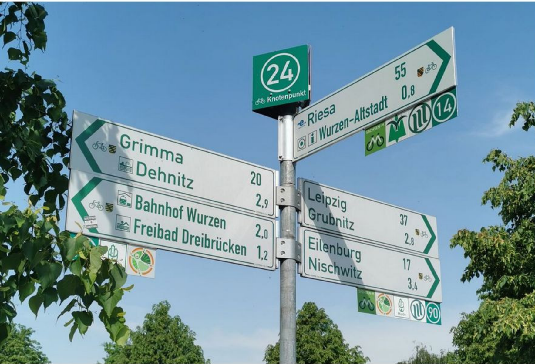
Wegweisungsposten mit Knotennummer