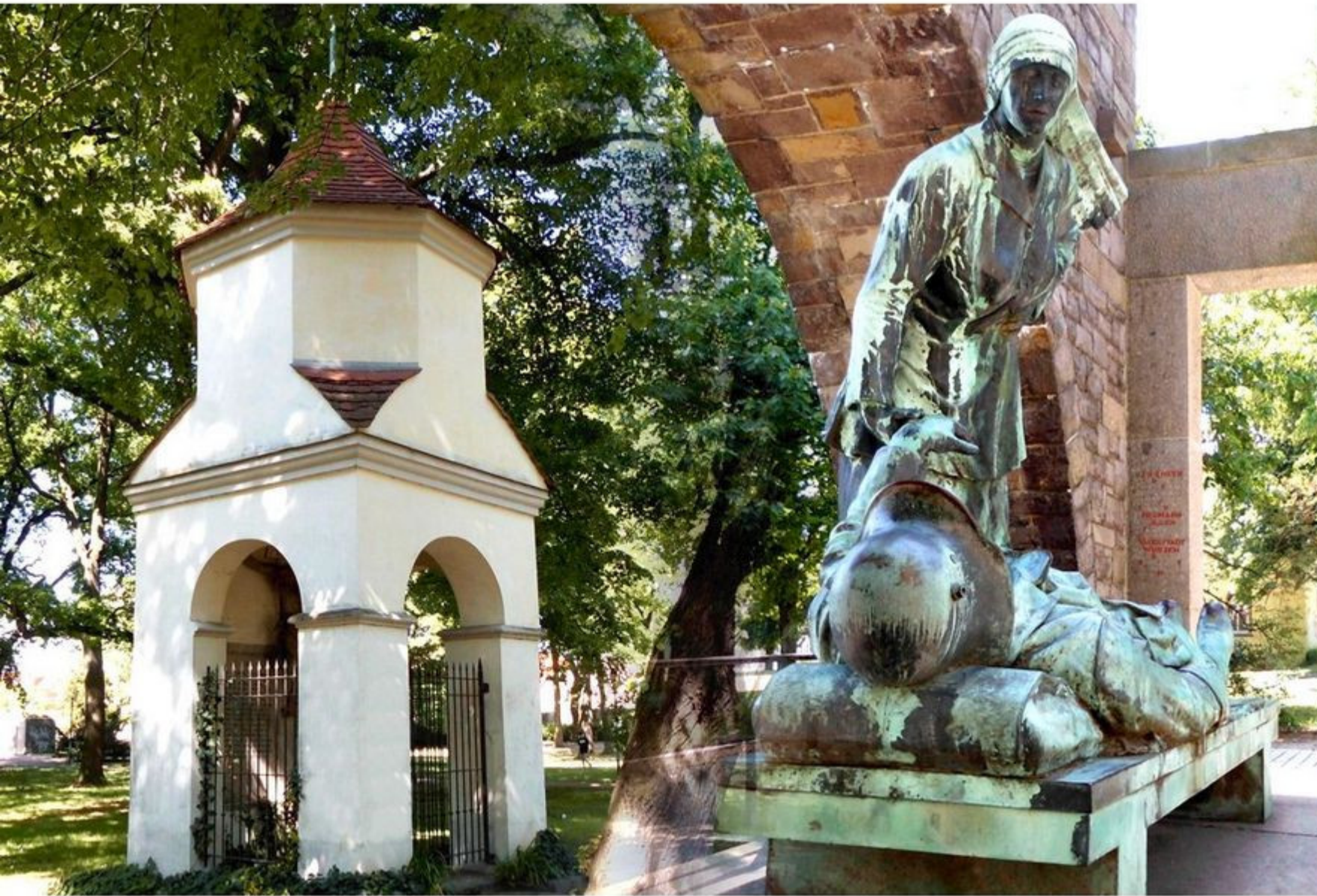
Pesthäuschen und Kriegerdenkmal auf dem Alten Friedhof