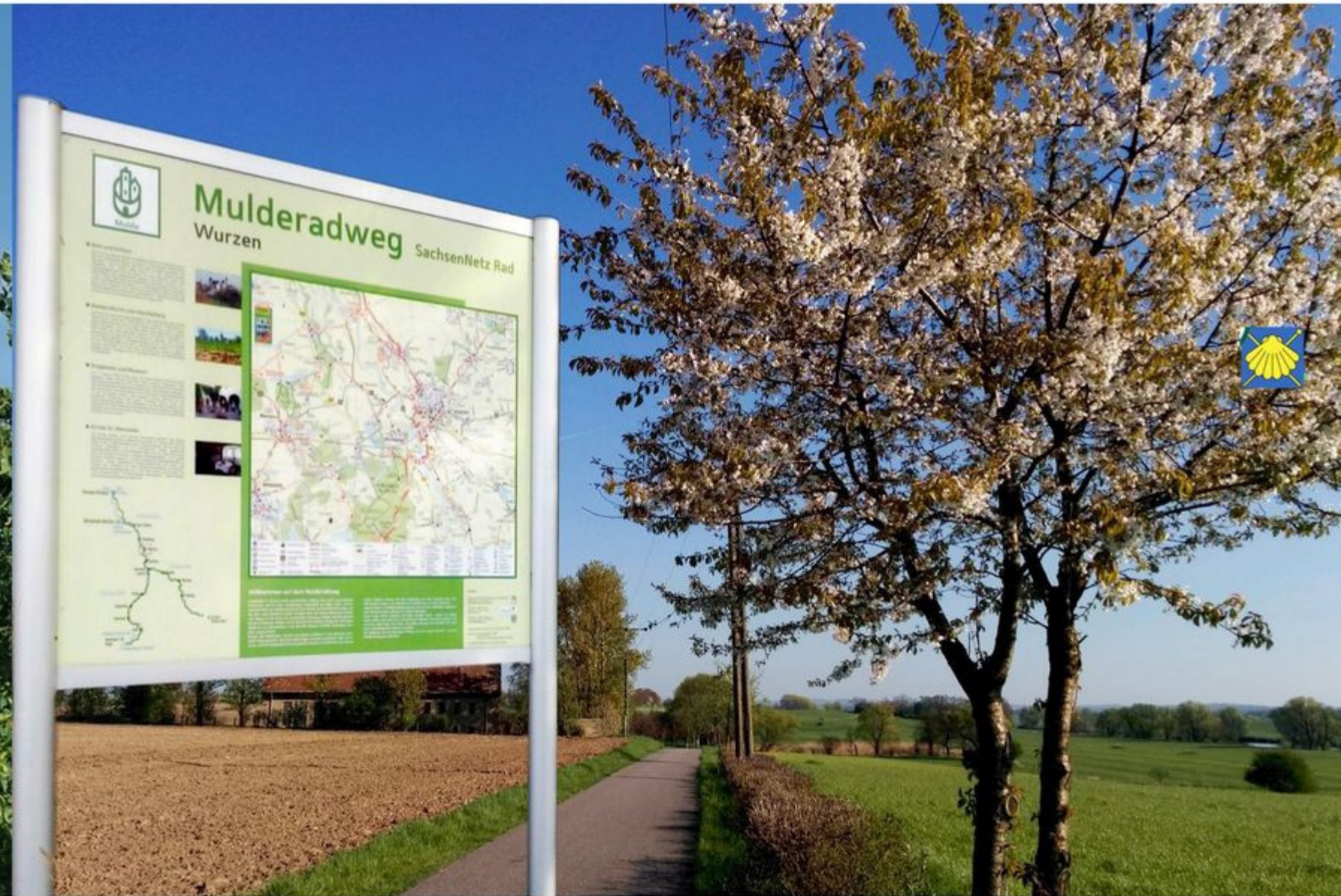
Der Mulderadweg von Dehnitz Richtung Oelschütz

A usgangs- und Endpunkt vieler interessanter Routen ist die Stadt Wurzen. Eine Vielzahl an Ausflugszielen und Erholungsmöglichkeiten sowie die herrliche Landschaft entlang des Flusslaufes der Mulde mit einer einzigartigen, vielfach naturbelassenen und unter Schutz gestellten Tier- und Pflanzenwelt machen das Wurzener Land touristisch reizvoll und sehr erlebnisreich.