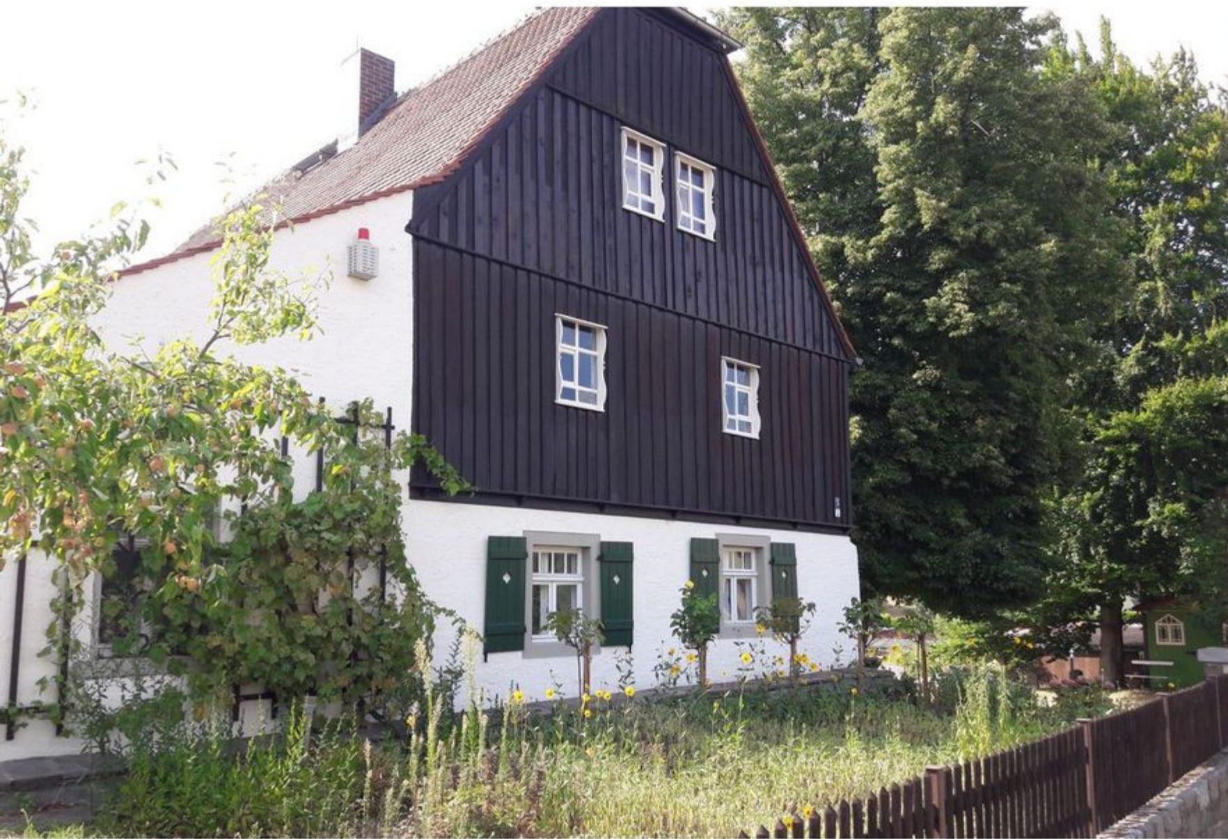
Museum Steinarbeiterhaus in Hohburg