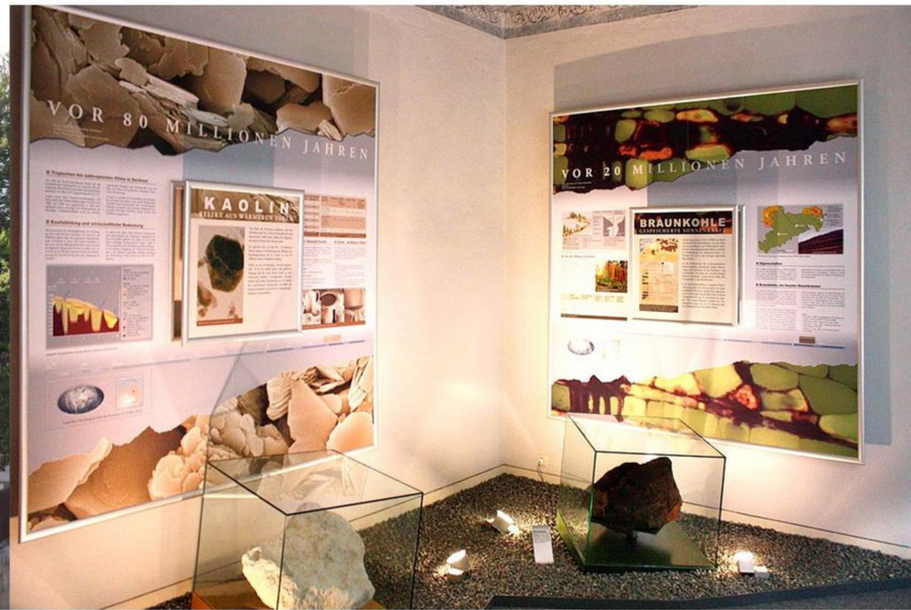
Dauerausstellung „Zeit, Wandel, Stein – bewegte Geologie einer Landschaft“ im Geoportal Röcknitz

Öffnungszeiten: Mi-So 10.00-16.00 Uhr; Museumsführungen auf Anmeldung