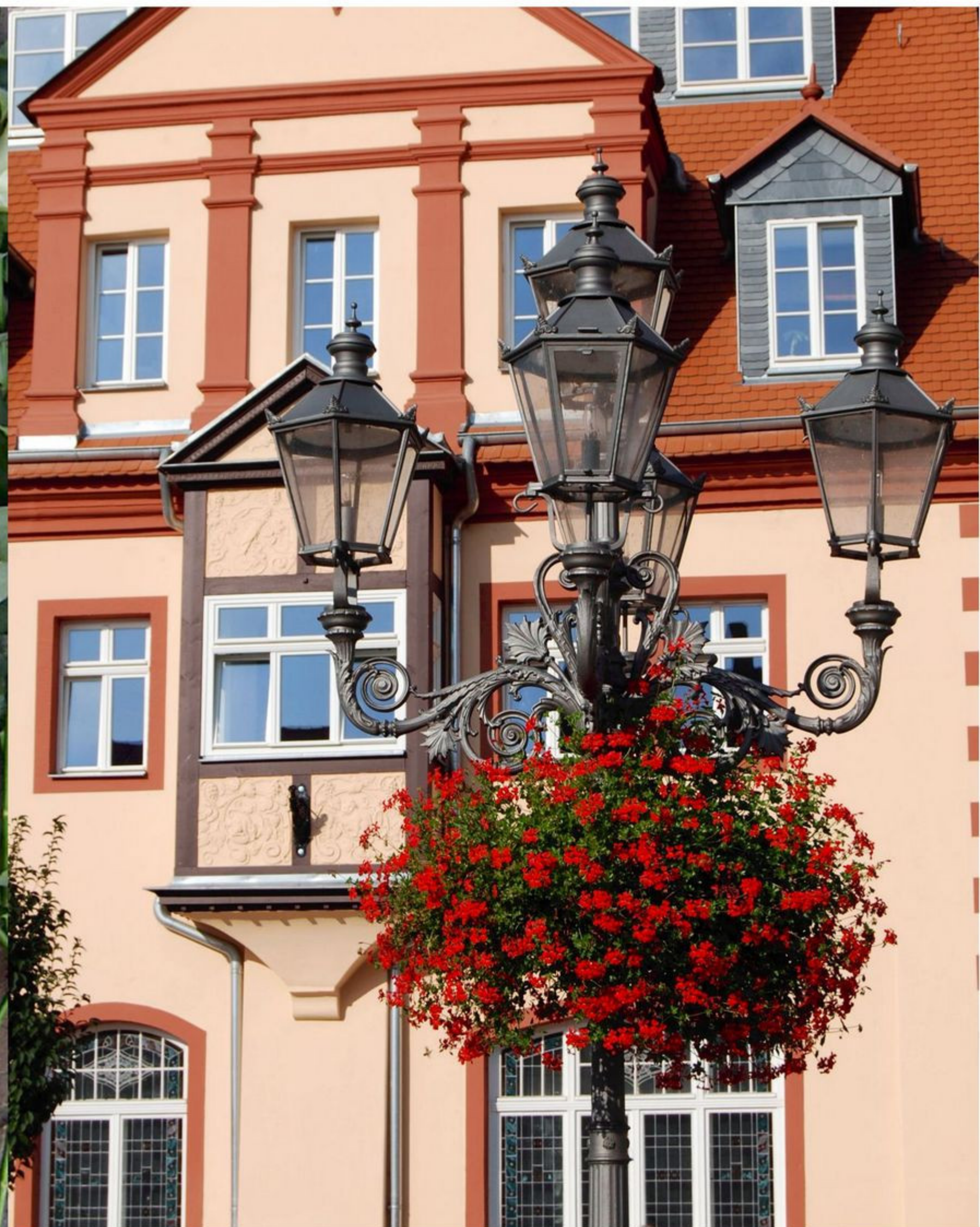
Die Kandelaber sind ein ganz besonderer Schmuck des Marktes.

Weitere Informationen erhalten Sie im Internet unter: www.stolpersteine.com .