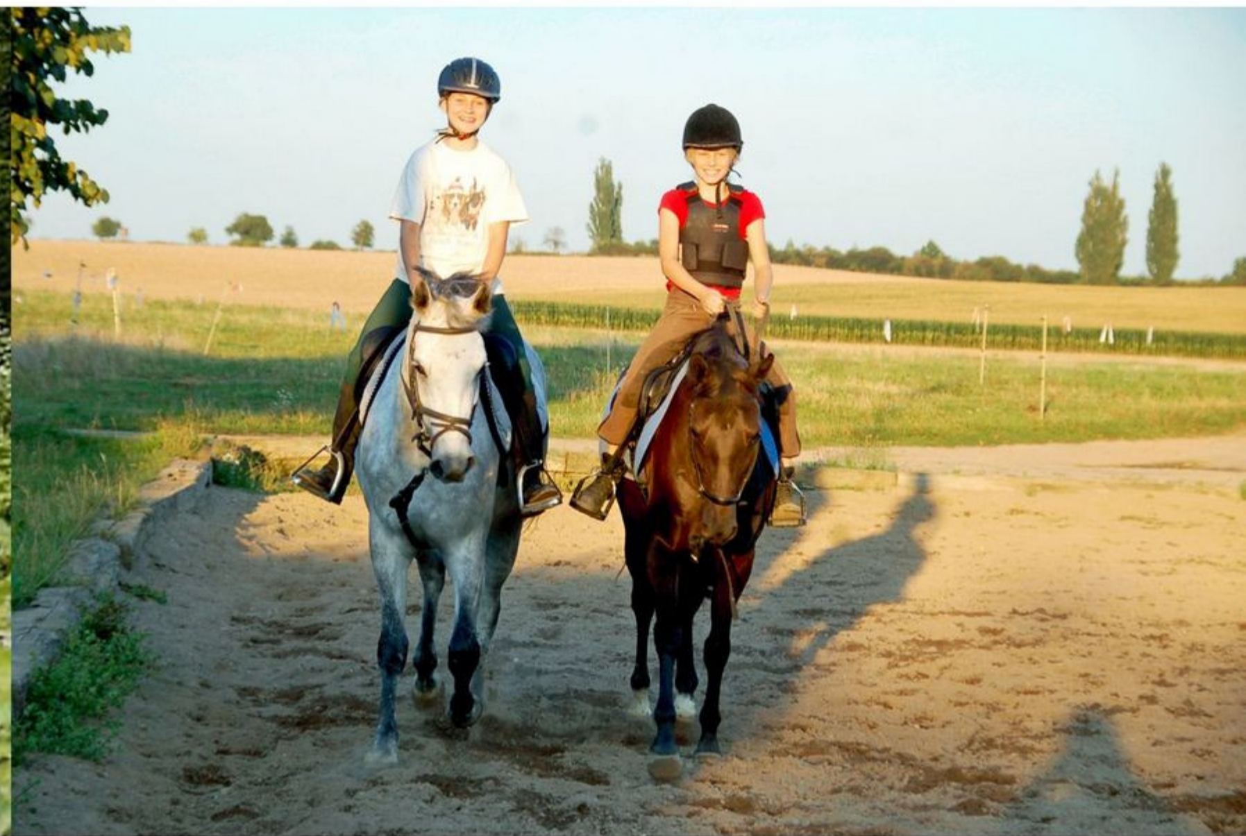
Hoch zu Ross